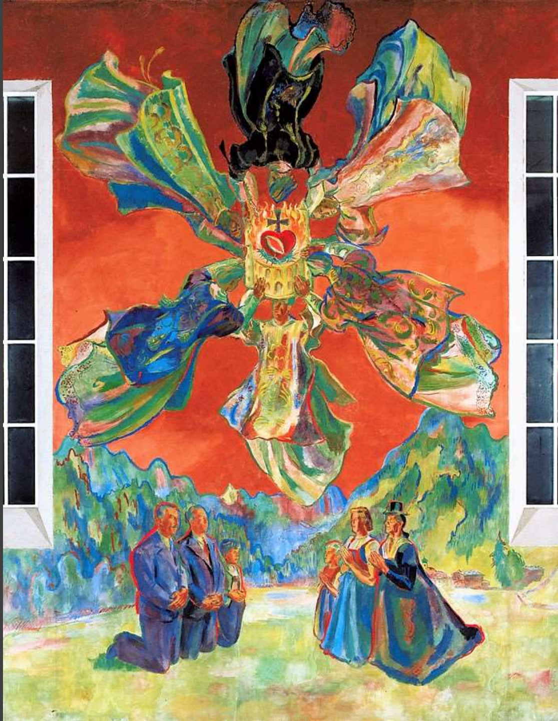
Max Weiler (Absam 1910 – 2001 Wien) Herz-Jesu-Sonne 1947

Fresko, ca. 700 x 665 cm Innsbruck-Hungerburg Pfarr- und Wallfahrtskirche Hl. Theresia vom Kinde Jesu Ostwand Mitte