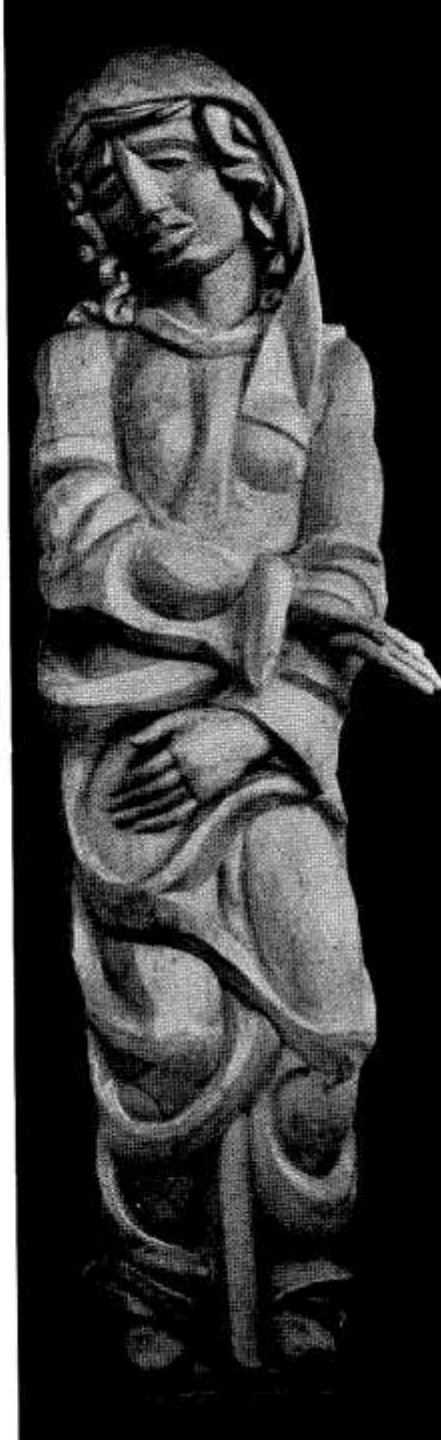
Franz Santifaller (Meran 1894 – 1953 Innsbruck) Die drei göttlichen Tugenden Hoffnung – Liebe – Glaube 1926/27

Lindenholz, grün getönt, H. jeweils ca. 300 cm Innsbruck Städtischer Westfriedhof Einsegnungshalle Nordwand