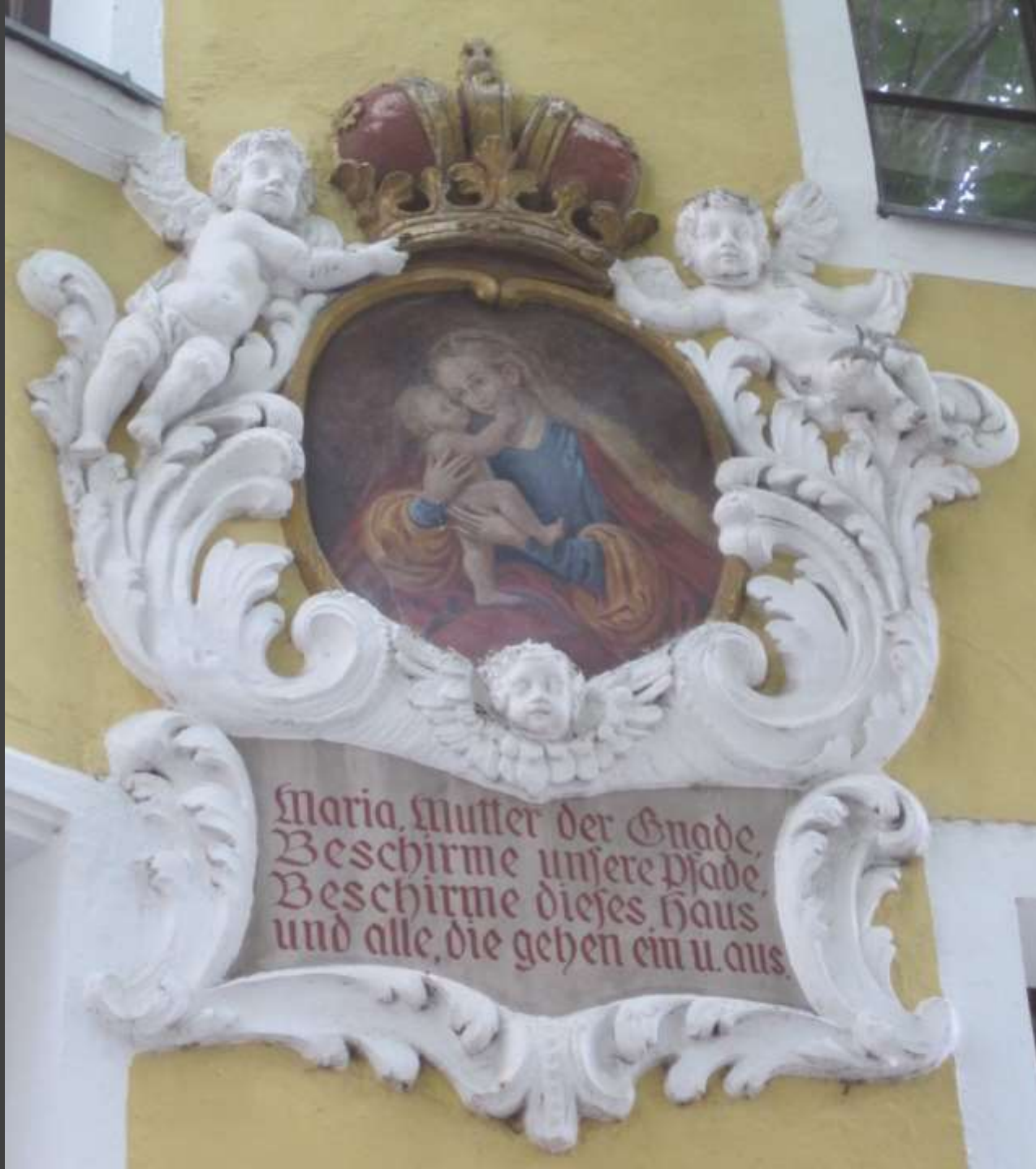
Mariahilf in Stuckumrahmung Um 1700

Innsbruck Stiftsgasse 12 Fassade im Norden