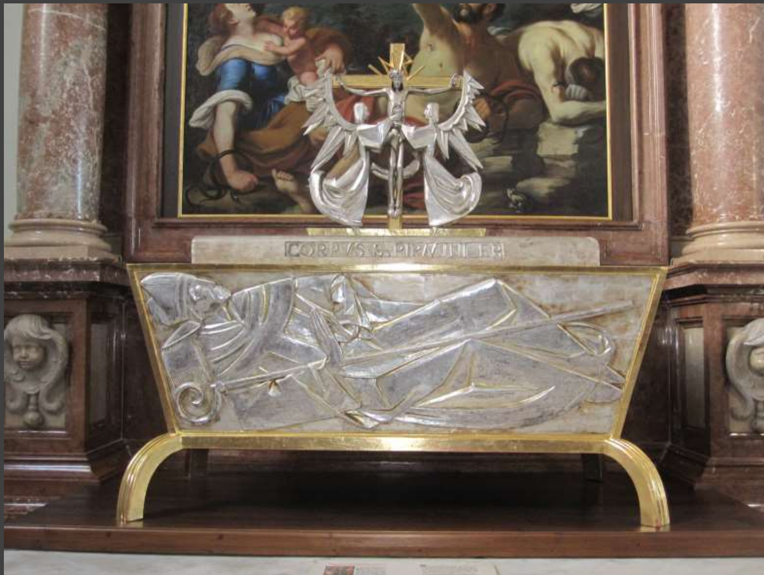
Rudolf Millonig (geb. 1927 in Hall i. T.) Reliquenschrein für die Gebeine des hl. Pirmin 1954

Holz, Metall, versilbert, vergoldet, 160 x 90 x 70 cm Innsbruck Jesuitenkirche Hl. Dreifaltigkeit Linke Seite Südliche Seitenkapelle Mensa