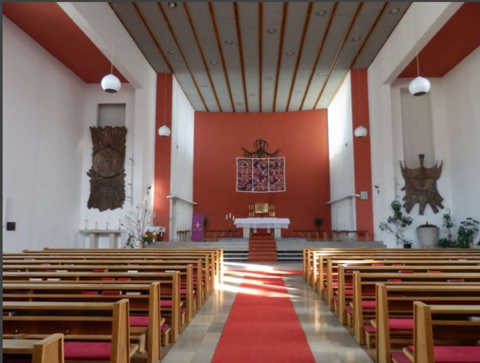
Pfarrkirche Hl. Familie, Innsbruck, Wilten-West. Erbaut 1955–1957 nach Plänen von Martin Eichberger.